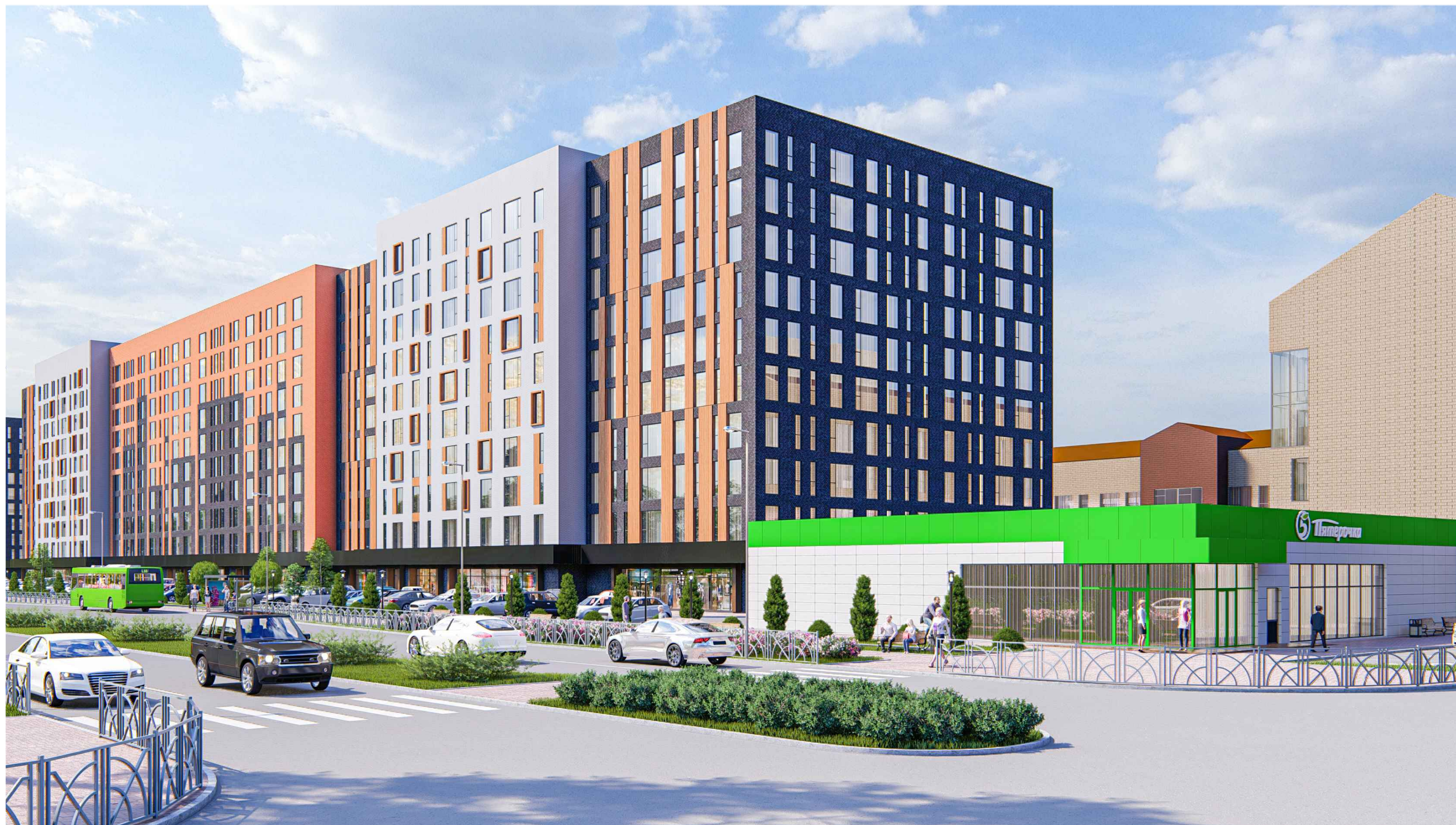
Жилой комплекс по адресу: Россия, Ставропольский край, г. Ставрополь, ул. 45 Параллель (кадастровый номер участка 26:12:012001:10439)